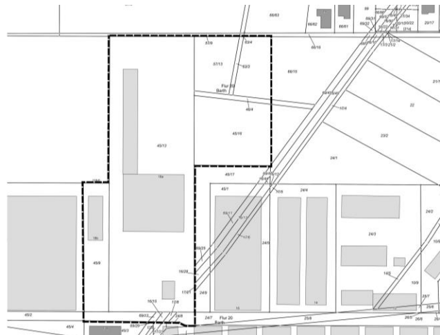
Grenze des räumlichen Geltungsbereiches der 1. Änderung und Ergänzung des Bebauungsplanes Nr. 34 der Stadt Barth (o. M.)

Das Plangebiet umfasst eine Fläche von rd. 2,7 ha auf und wird wie folgt begrenzt: