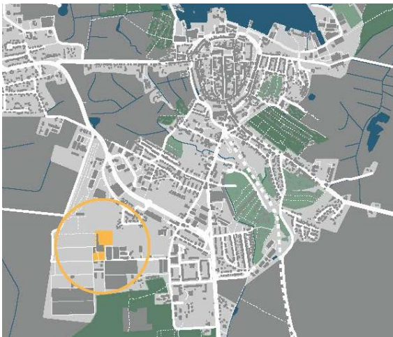
Lageplan (Abbildungsgrundlage: © OpenStreetMap contributors, o. M.)

Das Plangebiet der 1. Änderung und Ergänzung des Bebauungsplanes Nr. 34 liegt im südwestlichen Siedlungsbereich der Stadt Barth, im nördlichen Bereich der ehemaligen Großgärtnerei, nördlich der Nelkenstraße.